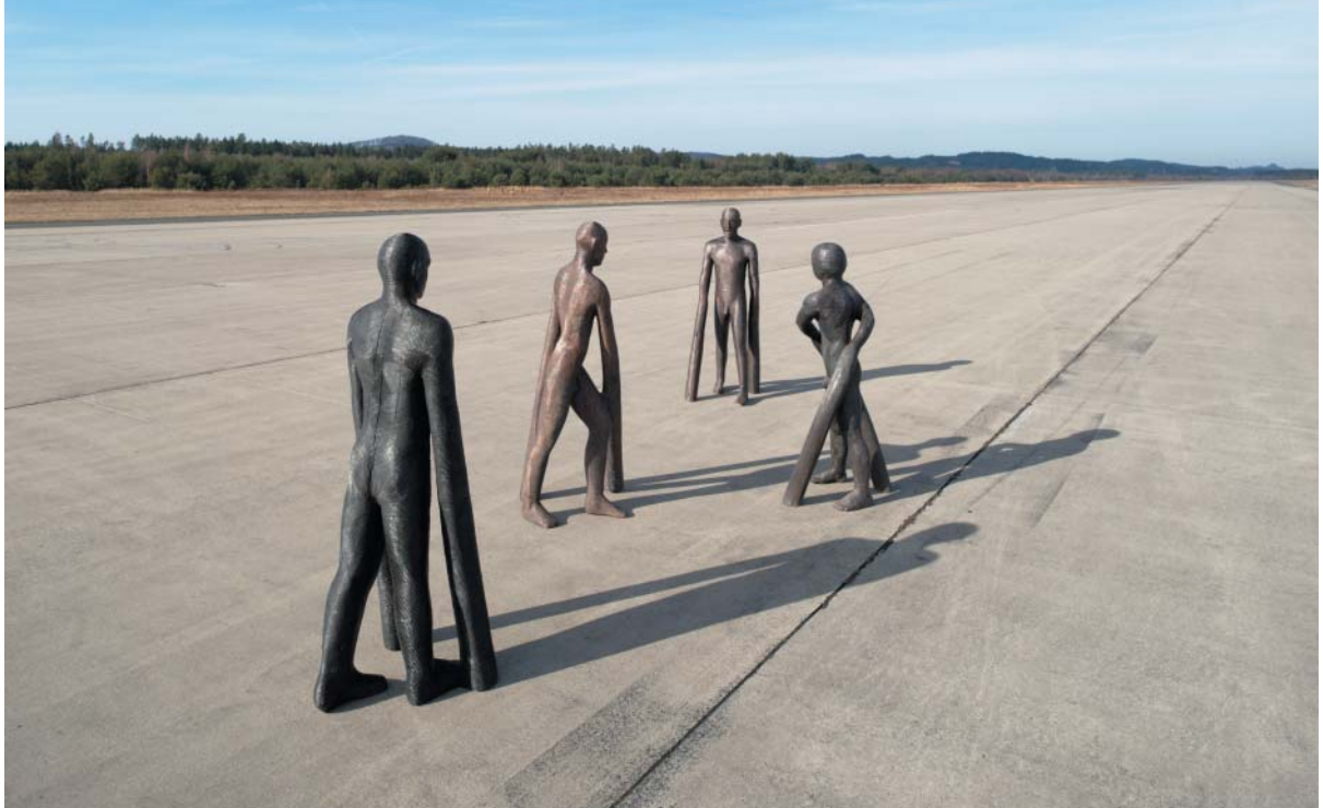
Hráči 2000–2009 bronz, vojenský prostor v Hradčanech 2008