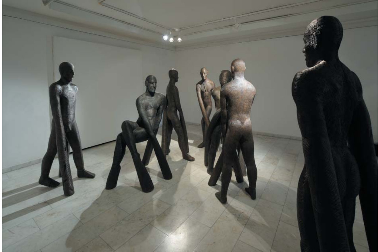
Hráči 2000–2009 bronz, výstava Tvrdohlaví ve Středočeské galerii 2008

„Hráči“ jsou výtvarným řečením o lidské existenci, o životě, který se odehrává v prostoru, který je omezen, ale zároveň otevřen. Jsou to lidé, kteří se snaží najít svůj smysl a místo v tomto světě. Jejich postavy jsou stylizované, ale zároveň velmi lidské. Jejich držení těla a pohyby jsou plné výraznosti a dynamiky. Jejich tváře jsou bez výrazu, což jim dodává určitou anonymitu a zároveň jim umožňuje být ztotožněni s každým z nás. Jejich přítomnost v prostoru působí jako výzva k reflexi a k hledání odpovědí na otázky, které se nám kloubejí v mysli. Jejich díla jsou nejen esteticky velmi zajímavá, ale také velmi myšlenkově bohatá. Jejich tvorba je plná symboliky a metafor, které nás vedou k hlubšímu pochopení lidské existence. Jejich díla jsou tedy nejen uměleckými, ale i filozofickými a sociálními komentáři. Jejich tvorba je plná síly a vnitřní dynamiky, která nás nutí k reflexi a k hledání odpovědí na otázky, které se nám kloubejí v mysli. Jejich díla jsou tedy nejen uměleckými, ale i filozofickými a sociálními komentáři.