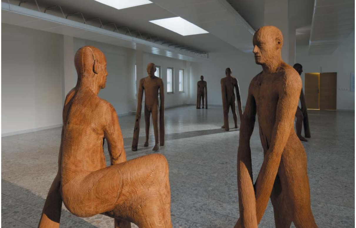
Hráči 2000–2009 dřevo dub, výstava v galerii města Blanska 2008

Jejich jedinečnost tkví v neustálé proměně, kdy zasazené do rozmanitých prostředí spoluutvářejí genius loci. Autor tak podvědomě navazuje na kvalitu české barokní sochy v krajině a „umírající“ a přesto nesmrtelný Braunův Betlém. Vnímáme tajemství soch, lidí a bytí neustále objeované a znovuzrozené. Je v nich jejich vlastní historie a život, záhadný příběh, který v minulosti žily. Zde vidím, u autora často citovanou paralelu s mýtickou minulostí a prehistorií věcí i lidí. V jeho projevu je niternost a citovost skrytá pod povrchem a zdánlivě chladný projev má vždy hlubší význam.